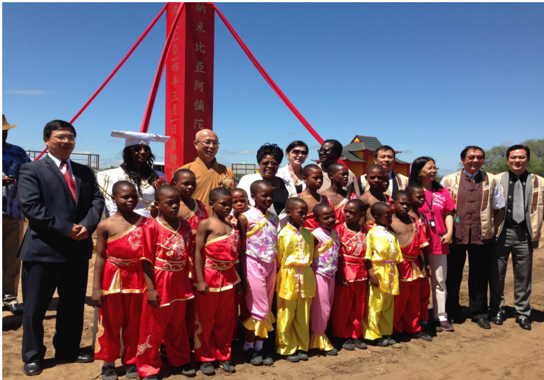
納米比亞前 第一夫人參 加院區開幕 儀式