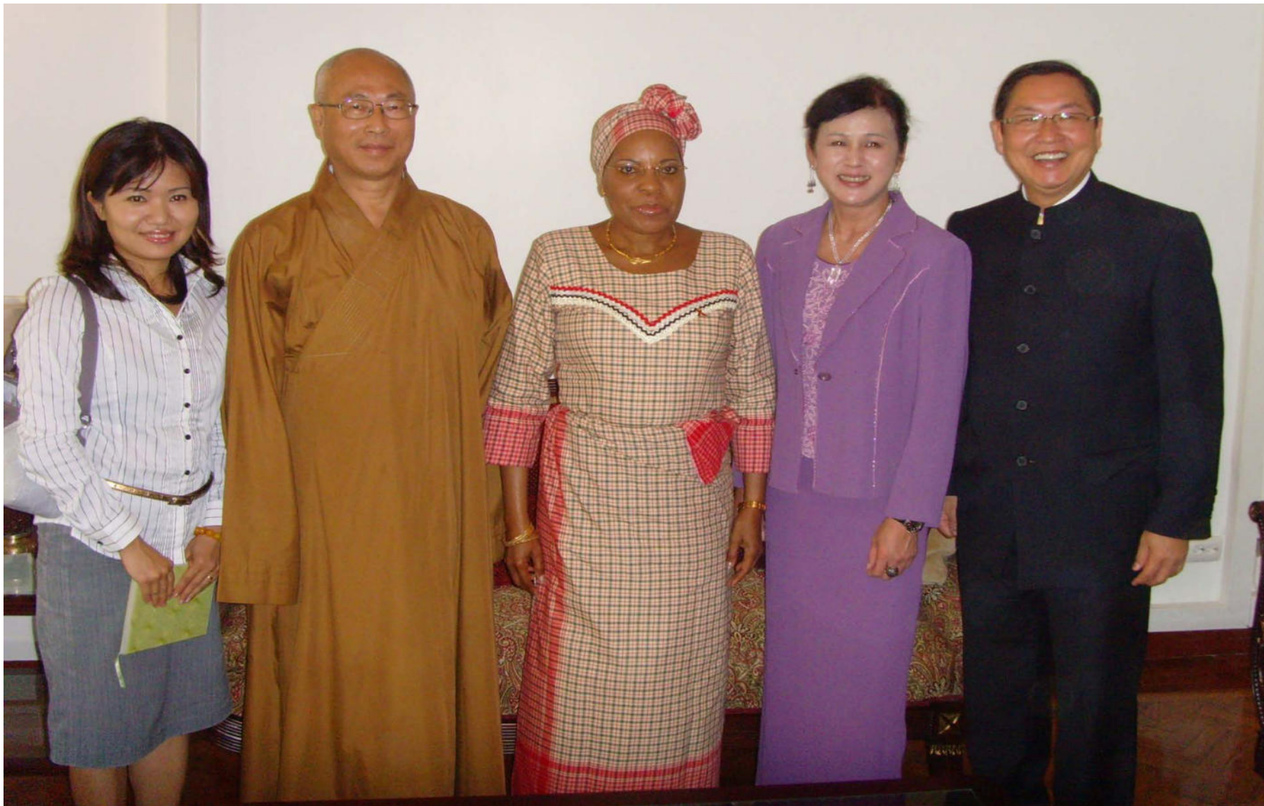
慧禮法師與 ACA執行長 拜訪莫三比 克第一夫人