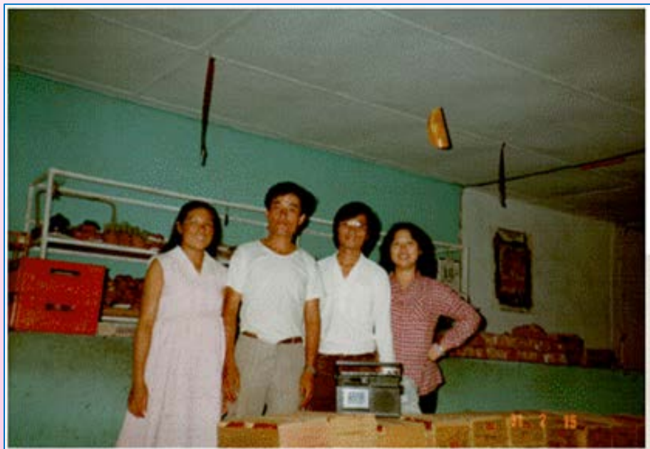
和夫婿在兄長的蔬果公司從事運輸