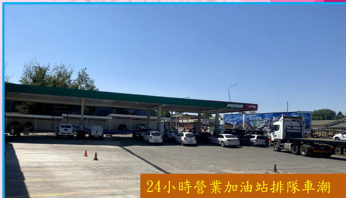
24小時營業加油站排隊車潮