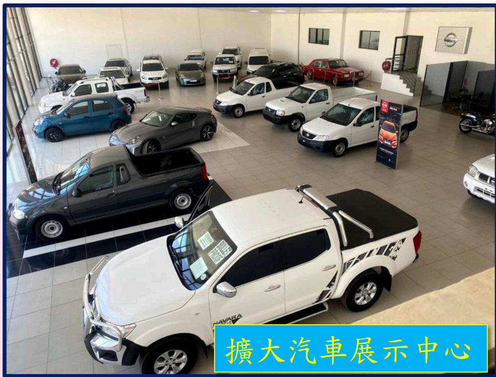
擴大汽車展示中心