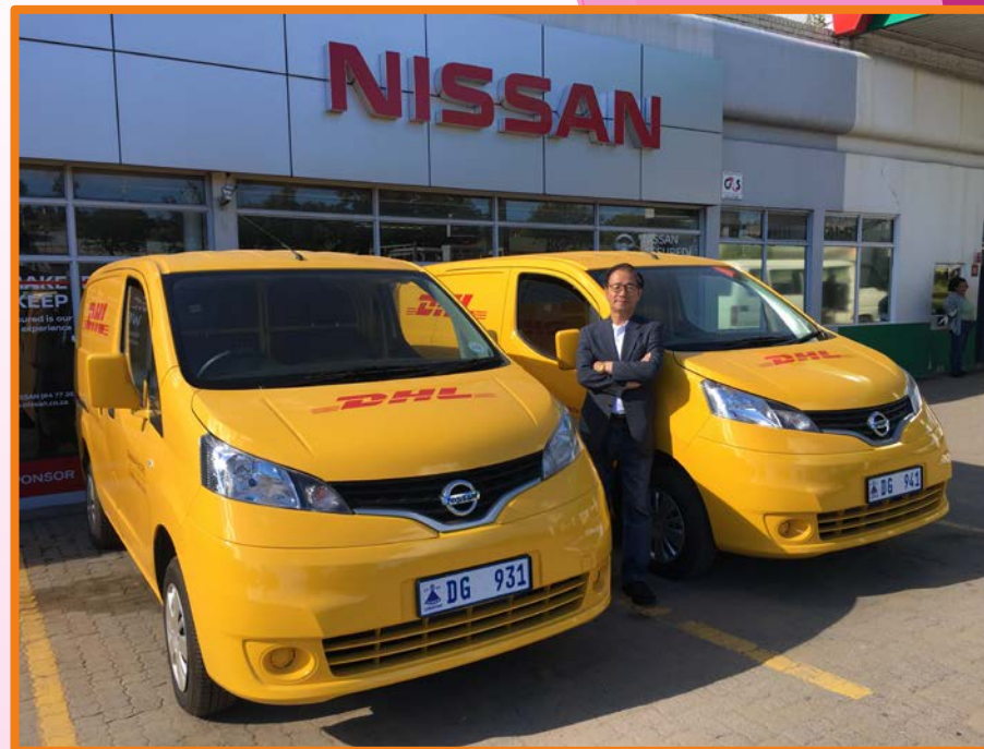
知名運輸業訂購的新款廂型車