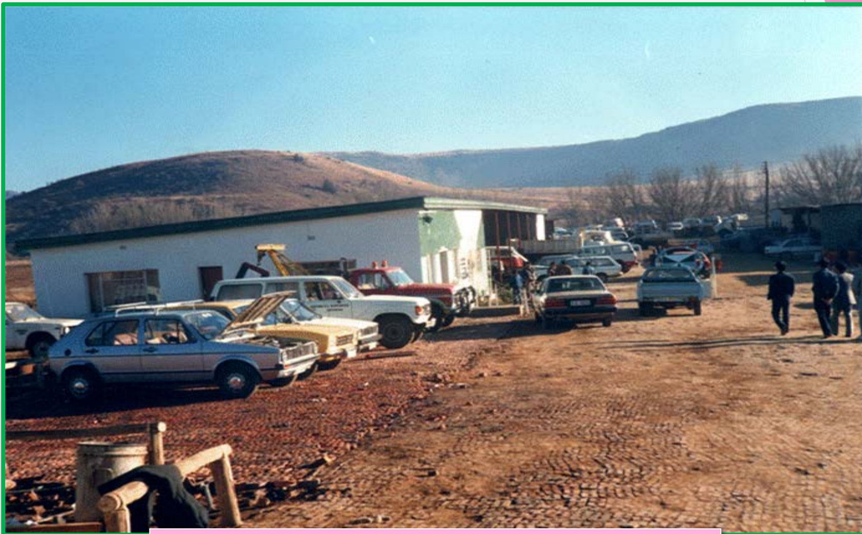
草創時期簡陋的維修廠