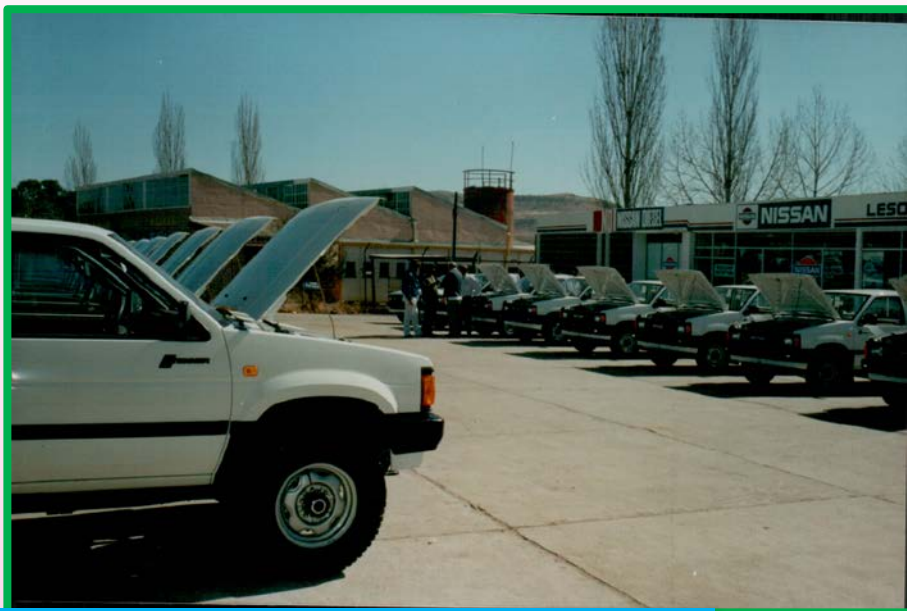
政府採購車輛，交車前全面檢查